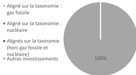
Alignement sur la taxonomie incluant l'exposition aux obligations souveraines*