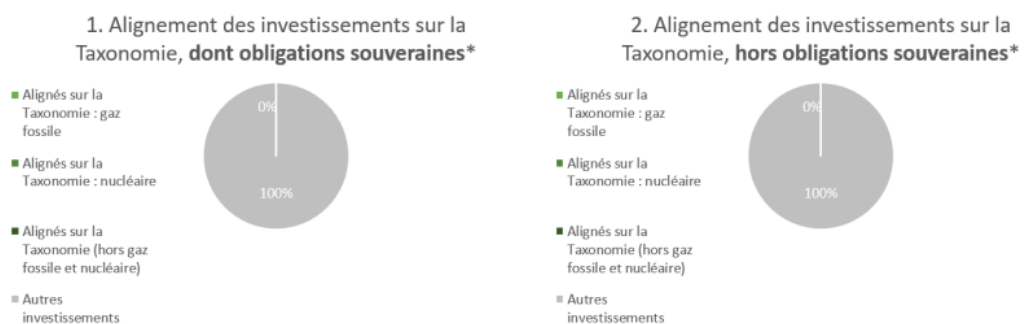
Ce graphique représente 100% des investissements totaux.

Les deux graphiques ci-dessous montrent, en vert, le pourcentage minimum d'investissements alignés sur la Taxonomie de l'UE. Comme il n'existe pas de méthodologie appropriée pour déterminer l'alignement des obligations souveraines* sur la Taxonomie, le premier graphique présente l'alignement du produit financier sur la Taxonomie en regard de l'ensemble des investissements qui le composent, y compris les obligations souveraines, tandis que le second graphique illustre l'alignement sur la Taxonomie uniquement en regard des investissements autres que les obligations souveraines.